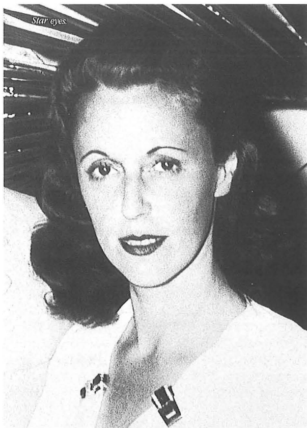
Baronesa Pannonica de Koenigswarter

lugar en el año de 1971 y terminó con una larga serie de grabaciones de Monk en solitario, último e impresionante recuerdo del hombre que más hizo por el piano del jazz en nuestro tiempo.