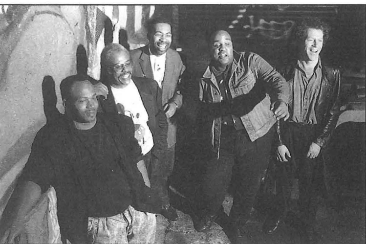
Sonny Sharrock Group

A KF Goes to the Northwest , primera referencia de su discográfica, (KFWCD 101), han seguido otros recopilatorios: KF Tours Europe 91 (KFWCD 105) con, entre otros, Blood Ulmer y Thomas Chapin; KF Goes To Vassar (KFWCD 121), con Jazz Passengers, Defunkt o Chapin; What's Jazz (KFWCD 109) con material de tres de los grupos que participaron en el KF Jazz Festival del 91: Jazz Passengers, Thomas Chapin y Semantics –Ned Rothenberg, Samm Bennett, Elliott Sharp–. Curioso es el también recopilatorio Downtown Does The Beatles Live at The KF , en el que habituales de la casa ( Les Miserables Brass Band , Defunkt, Alex Chilton, Samm Bennett...) entran a saco en el repertorio Beatle.