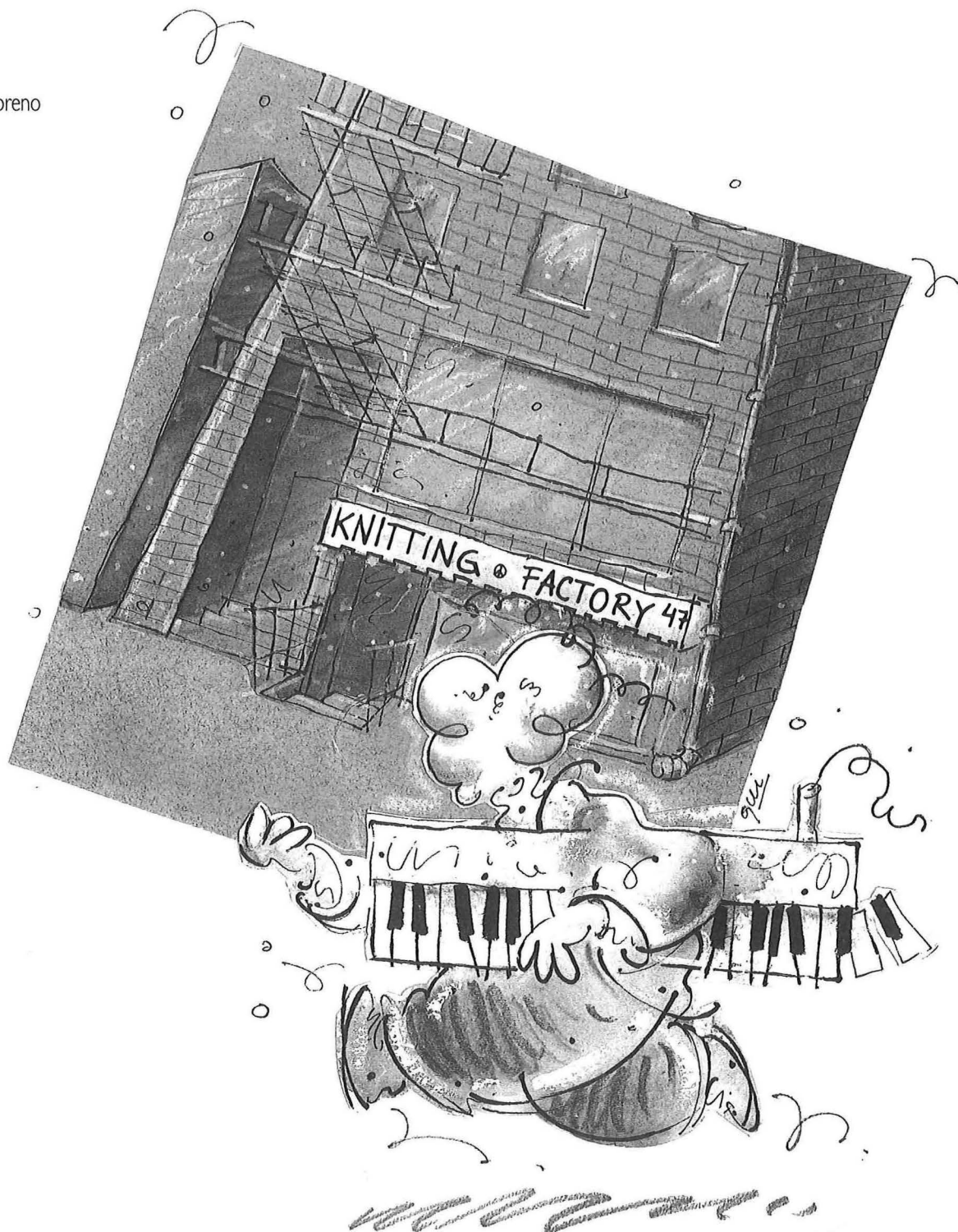
Ilustración: Enrique Krause